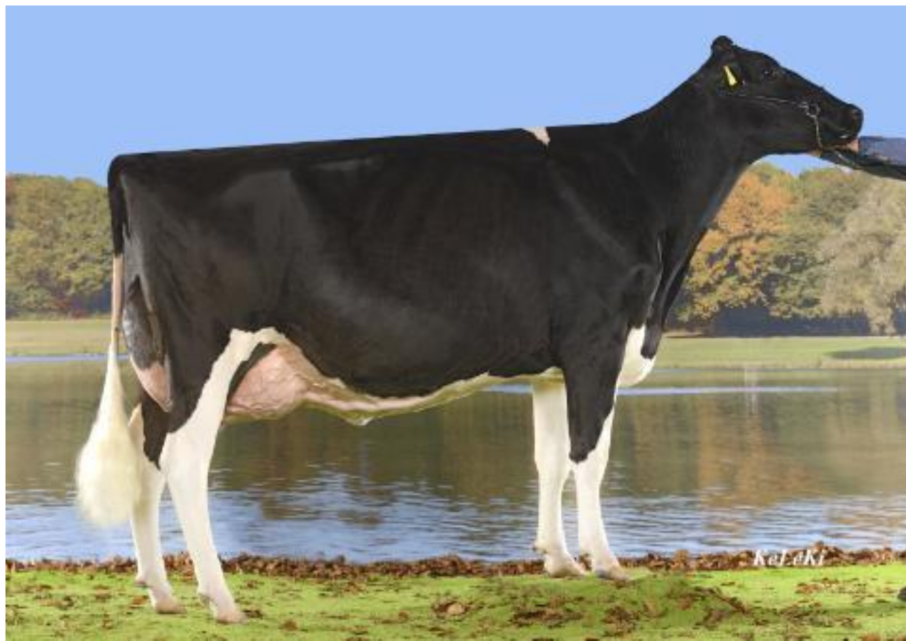
Mutter von Talulla: Lavande EX-92

Bürkli-Holst Tonka Talulla aus der Ghor Lavande EX-92. Die Kategoriensiegerin an der Aargauer Eliteschau 2016 ist eine besondere Rotfaktor - Kuh mit enorm viel Ausdruck und einem super Euter. Lavande stammt aus einer tiefen roten Kuhfamilie.