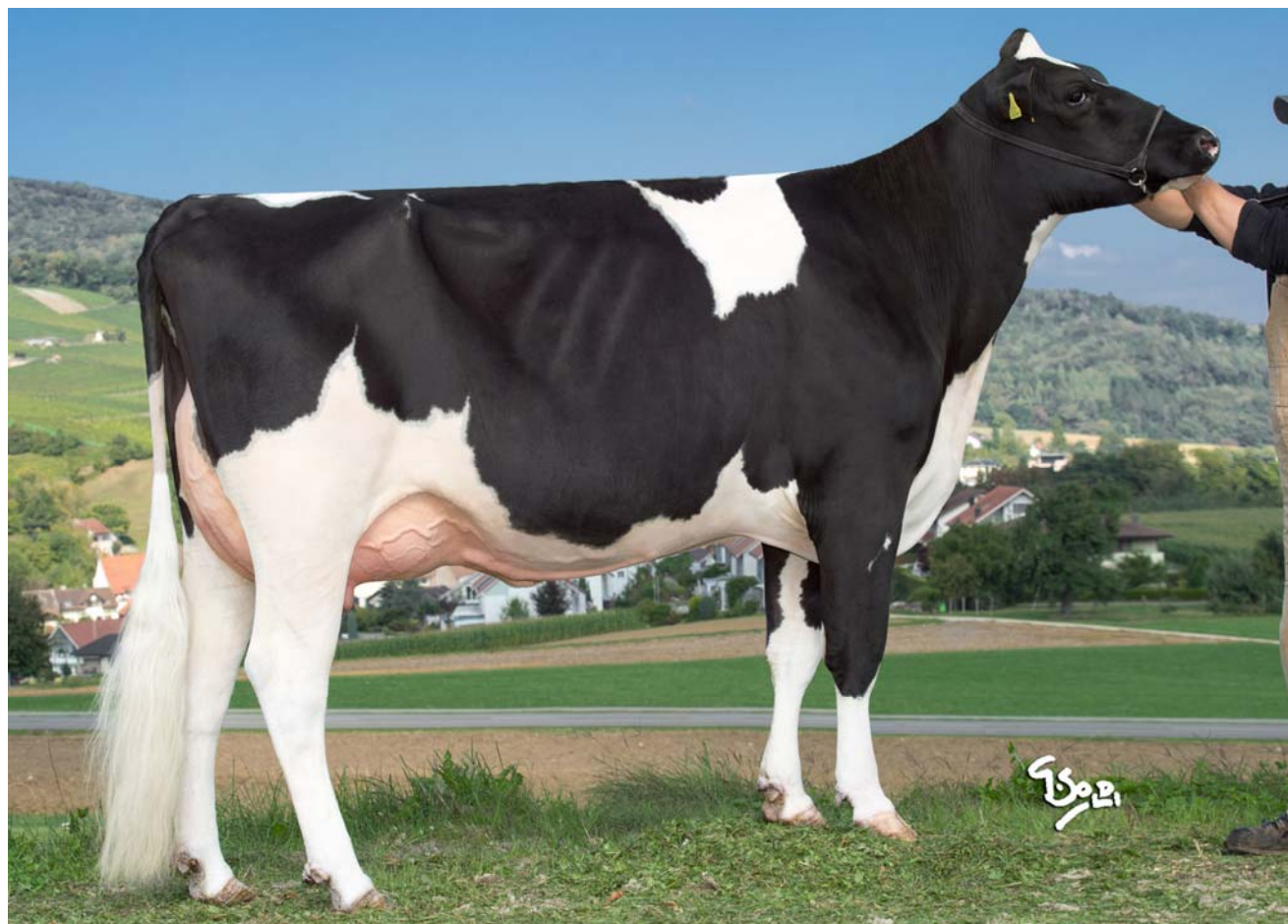
Mutter von Loreen: Swisslor Wyman Lorna L1 G+ 84

Im Angebot 2 gesexte Embryonen von Hisaka Mcdougal Loreen x Randall (Nummer 1 in der Schweiz). Die Mutter von Loreen ist nachwievor bei Swissgenetics eine Vertragskuh und stammt aus der bekannten Lystel Bolton Lorana EX-91 (Res. Int. Champion Swiss Expo 2011, HM Grand Champion Expo Bulle 2012)