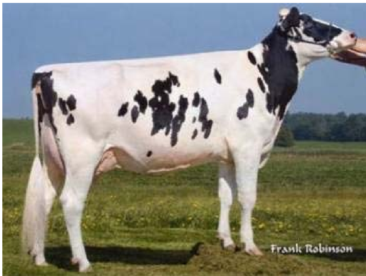
Grossmutter von Tamara: Delaberge Shottle Regine EX-90-2E-CAN

Randall Embryonen von Tamara, aus der Familie von MR SAM und Samuelo! MR Milano ist bei Swissgenetics im Einsatz, er ist der Bruder zu Tamara. Tamara hat bereits genomisch hoch getestete Töchter von Bankroll und Rodanas.