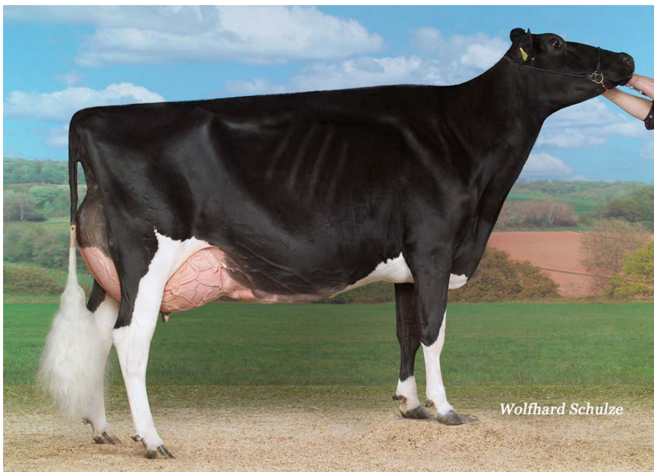
Die Grossmutter von Sid Enjoy: Du Bon Vent Stormatic Atacama EX-95 2E

Enjoy ist eine Zuchtkuh aus der bekannten Du Bon Vent Stormatic Atacama EX-95. Sie gewann unter anderem die Expo Bulle 2012 und wurde im gleichen Jahr vom Holstein Fachmagazin HI hinter RF Goldwyn Hailey zur Vice - Weltsiegerin gewählt. Enjoy ist in der 1. Lakt. G+ 84 mit einem VG-87 Euter eingestuft.