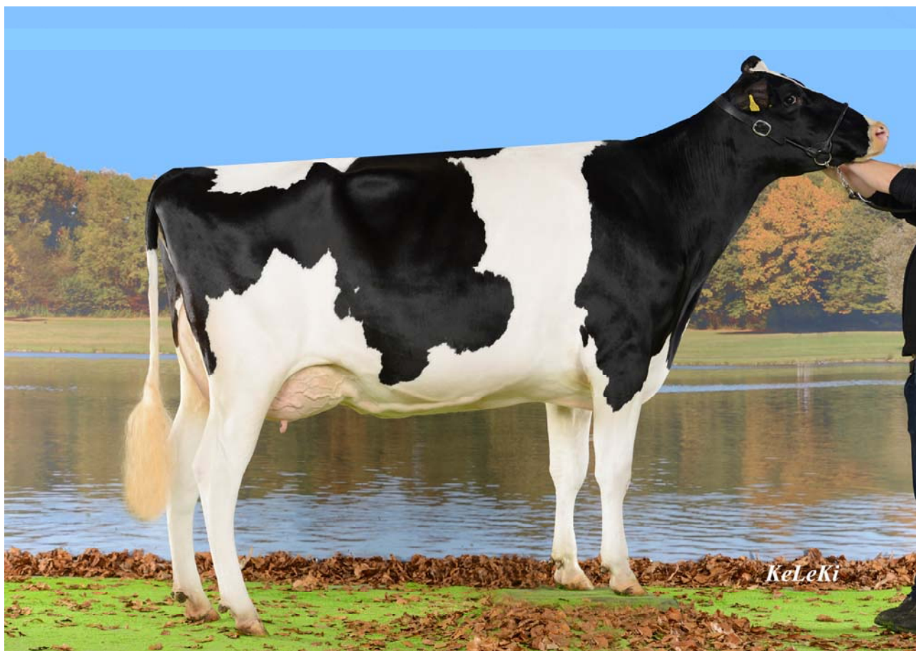
Mutter von Cana: Riedmuellers Detox Pam-ET

Die Mutter von Cana ist eine Detox Tochter, sie führt zur Zeit die RF-Elitekuhliste bei Swissherdbook an. Weiter hat sie den Addiction Sohn Bombastic bei Swissgenetics, welcher jetzt als Prüfstier erhältlich ist. Pam hat schon 12 Nachkommen, wovon 8 genomisch getestet wurden mit ISET zwischen 1393 und 1482. Sie stammt aus der bekannten Buckhorn Advent Silke welche an der Auktion von Rinaldo Müller für 12600.- versteigert wurde. Vor Silke sind bereits 7 Generationen EX. Weiter besticht die Mutter von Cana mit Ihren Leistungen, so hat sie in 2 Laktationen bereits 31601 kg Milch produziert mit 5.10% Fett und 3.8% Eiweiss mit durchschnittlich 38 Zellzahlen. Ihr Exterieur wurde in der zweiten Laktation mit VG 88 im Euter und gesamthaft VG 86 beurteilt.