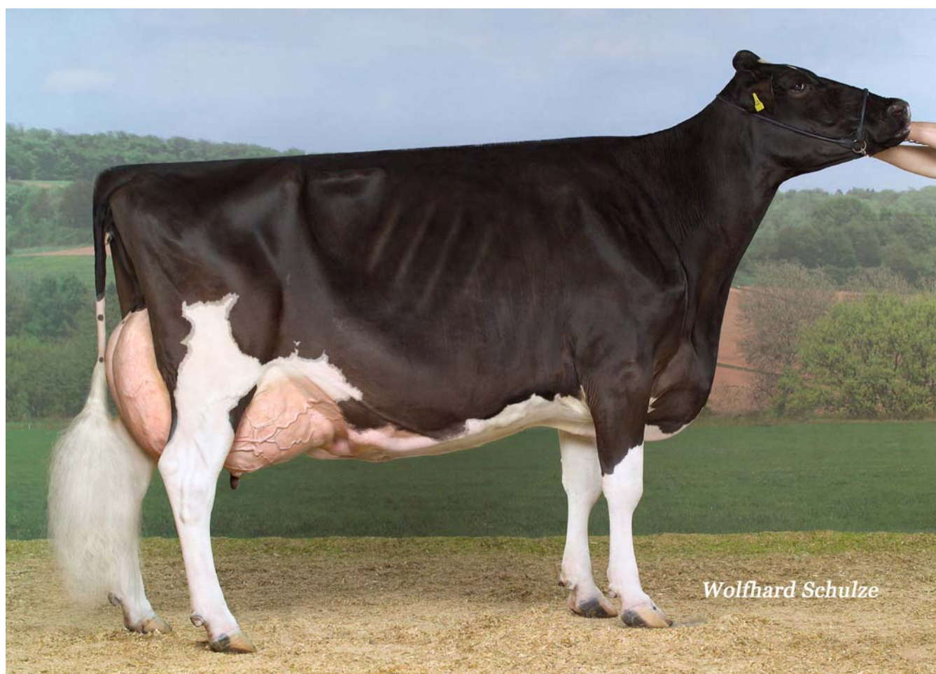
Ginny's Grossmutter: Hellender Juror Jurgolin EX-92 7E GM 29*

Hellender Atwood Ginny stammt aus der Familie der weltbekannten Hellender Juror Jurgolin EX-92 7E GM 29*. Mit einer Lebensleistung von über 150'000 kg, bereits mit 8 EX eingestuften Töchtern und mit ihrem Sohn Collin der ehemaligen Nr. 1 der nachzuchtgeprüften Stieren in der Schweiz, trat sie die letzte Reise an. Aktuell hat sie Nachkommen in 9 verschiedenen europäischen Ländern.