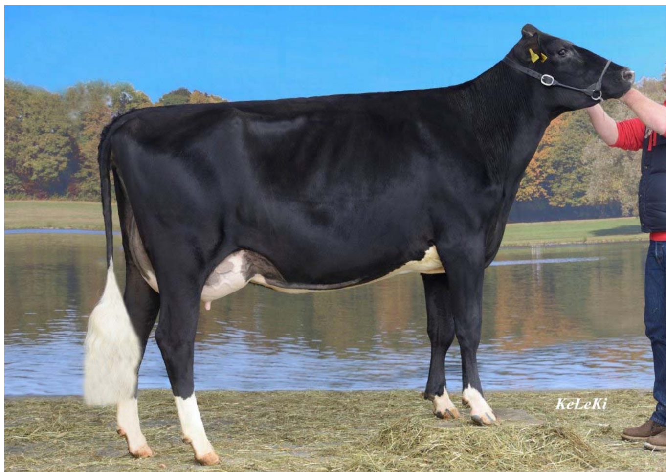
Riedmuellers Alexander Alaska EX 90