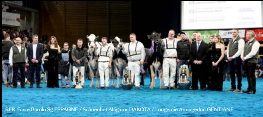
RER-Favre Barolo Sg ESPAGNE / Schoenhof Alligator DAKOTA / Longeraie Armagedon GENTIANE